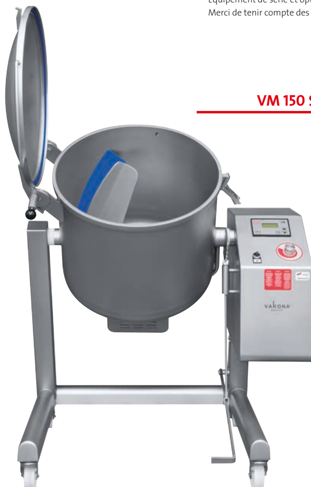
VM 150 STL

Equipement de série et options selon la taille et le type. Merci de tenir compte des informations entre parenthèses.